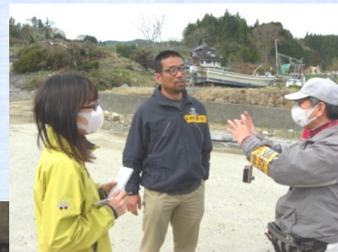
東日本大震災の被災地・岩手県の 共同取材（上）