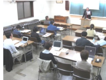
紙面編集の技術をとともに学び、研究します。会議などで機関紙会館を利用することもできます