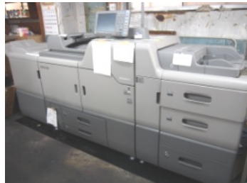
オンデマンド印刷機で小部数の印刷もリーズナブルに価格で可能に

自分史をつくりたい、作品をまとめて自費出版したい…。そんなご要望にもお応えし、企画・編集のお手伝いをします。印刷発注もできます。オンデマンド印刷機で小部数からでも安価で本を作ることができます。出版機能を生かして、書籍の流通の可能性も広がります。